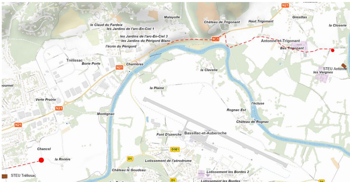
Localisation des deux postes de relevage et des conduites de refoulement

Que la conduite de refoulement sera également renforcée pour permettre les bonnes conditions hydrauliques du transfert des eaux usées : pose d'une canalisation diamètre 125 mm en fonte sur 420 ml.