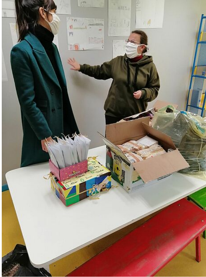
Deux maraudeuses sont présentes au centre de loisirs pour recueillir les dons, qui seront distribués aux personnes sans abri de la ville de Périgueux.