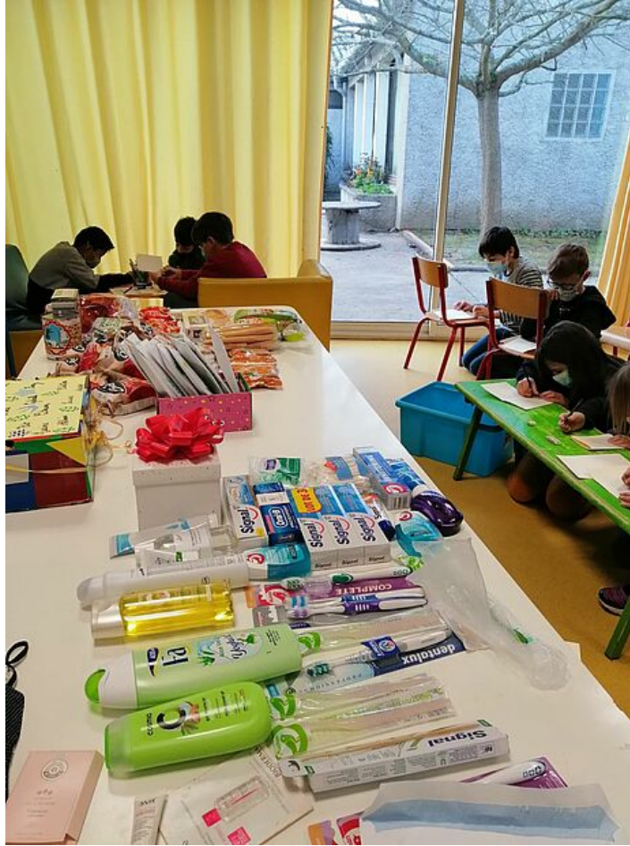
Les enfants écrivent des lettres de Noël pour les personnes sans domicile fixe.