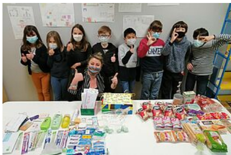
CENTRES DE LOISIRS, ENFANCE