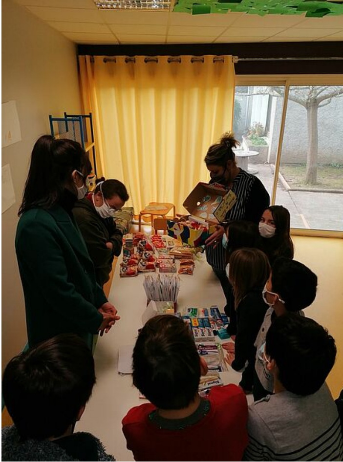
Enfants et adultes mettent la main à la pâte pour préparer les colis.