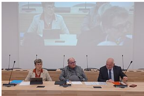
Le Grand Périgueux accueillait les Sénateurs le jeudi 18 avril 2024.