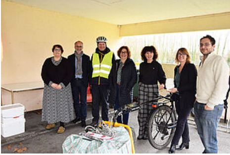
Le Grand Périgueux et ses partenaires s'engagent pour l'utilisation de couches compostables