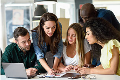
Five young people studying on white desk. Beautiful women and men working together wearing casual clothes. Multi-ethnic group.